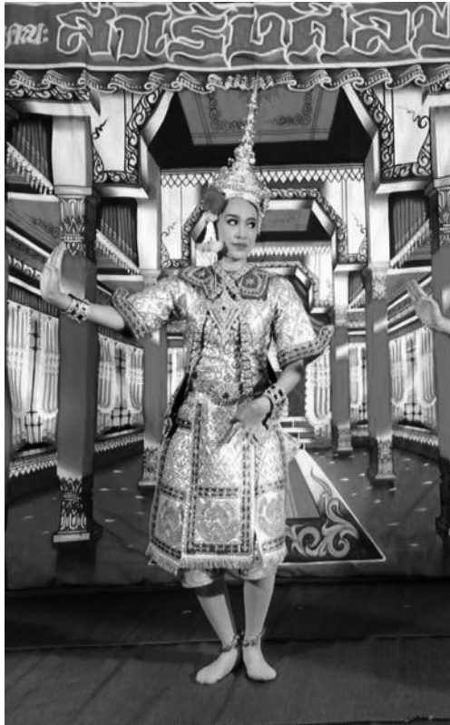
ภาพที่ 4 การแต่งกายของตัวละคร

เครื่องแต่งกายของตัวละครพระ ของคณะละครสำเร็จศิษย์มีดังนี้