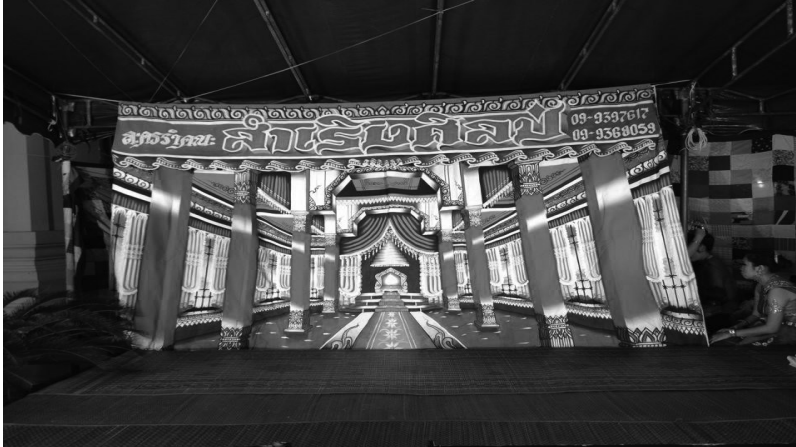
ภาพที่ 6 เวทีและฉาก

การแสดงละครชาตรี คณะสำเร้งศิลป์ อำเภอพุนสนิม จังหวัดชลบุรี มีการสร้างฉากประกอบการแสดง จะใช้ผ้าใบวาดเป็นท้องพระโรง เวทีอาจมีการยกสูงขึ้นมาประมาณ 1.5 เมตรและในบางสถานที่ก็ไม่ได้ยกเวทีเนื่องจากใช้พื้นที่ของศาลา หรือด้านข้างวิหาร ทั้งนี้ขึ้นอยู่กับความต้องการของเจ้าภาพ เวทีถูกมุงด้วยหลังคาผ้าใบอย่างดี มีทางเข้าออก 2 ทาง ด้านหลังเป็นที่ไว้สำหรับแต่งตัวของนักแสดง