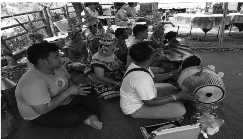
ภาพที่ 7 วงดนตรี