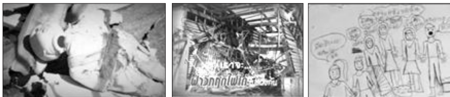
ภาพที่ 5 ภาพที่เชื่อมโยงสิ่งของหรือสัญลักษณ์กับเหตุการณ์ความไม่สงบ

นอกจากนี้ จากการสังเกตแบบมีส่วนร่วม พบว่า รหัสภาพที่ปรากฏในรายการ ได้ผ่านขั้นตอนการกำกับ 4 ช่วงจังหวะ คือ (1) ภาพที่ผู้สื่อข่าวกำหนดขึ้นในขั้นตอนการเขียนบท (2) ภาพที่บันทึกโดยช่างภาพ (3) ภาพที่ผ่านกระบวนการตัดต่อ (4) ภาพที่ผ่านการตรวจทาน และปรับแก้ไขโดยโปรดิวเซอร์ เช่น ตัดภาพทิ้ง เพิ่มภาพใหม่เข้ามา หรือยืดหดภาพให้สั้นหรือยาว และจากช่วงจังหวะในการกำกับภาพ พบว่า