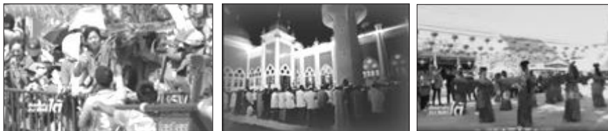
ภาพที่ 3 ภาพกลุ่มทางสังคมที่สื่อถึงความหลากหลายทางวัฒนธรรม

2) ภาพที่สื่อความหมายว่าด้วยความไม่สงบในจังหวัดชายแดนภาคใต้ ผู้ผลิตรายการเน้นการใช้สัญลักษณ์ภาพที่เกิดจากความเป็นเหตุเป็นผล (Index) ซึ่งเป็นสัญลักษณ์ที่เชื่อมโยงความสัมพันธ์กลุ่มคนกับเหตุการณ์ความไม่สงบ หรือสิ่งของกับเหตุการณ์ความไม่สงบ