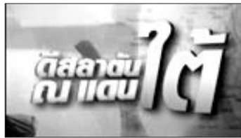
ภาพที่ 6 ชื่อรายการที่ปรากฏในไตเติ้ลรายการ

1) ชื่อรายการและไตเติ้ลรายการ เป็นการกำหนดวิธีการตั้งชื่อให้มี ความแปลก โดยการเล่นคำที่มีความหมายเดียวกันใน 2 ภาษา คือ ภาษามลายู (คำว่า ดีสลาตัน) และภาษาไทย (คำว่า “ณ แดนใต้”) โดยทั้ง 2 คำ แปลว่า ที่ภาคใต้ ซึ่งความหมายของชื่อสื่อถึงความเป็นคนในพื้นที่