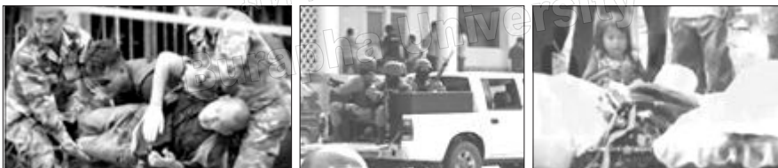
ภาพที่ 4 ภาพที่เชื่อมโยงกลุ่มคนกับเหตุการณ์ความไม่สงบ

2) ภาพที่สื่อความหมายว่าด้วยความไม่สงบในจังหวัดชายแดนภาคใต้ ผู้ผลิตรายการเน้นการใช้สัญลักษณ์ภาพที่เกิดจากความเป็นเหตุเป็นผล (Index) ซึ่งเป็นสัญลักษณ์ที่เชื่อมโยงความสัมพันธ์กลุ่มคนกับเหตุการณ์ความไม่สงบ หรือสิ่งของกับเหตุการณ์ความไม่สงบ