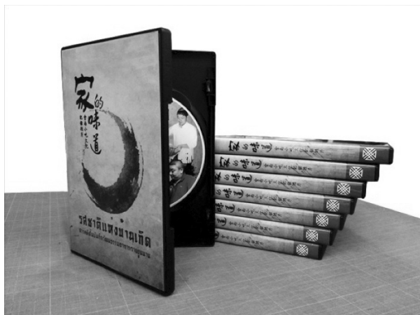
ภาพที่ 13 ซีดีสารคดีสั้นเรื่อง “รสชาติแห่งบ้านเกิด”