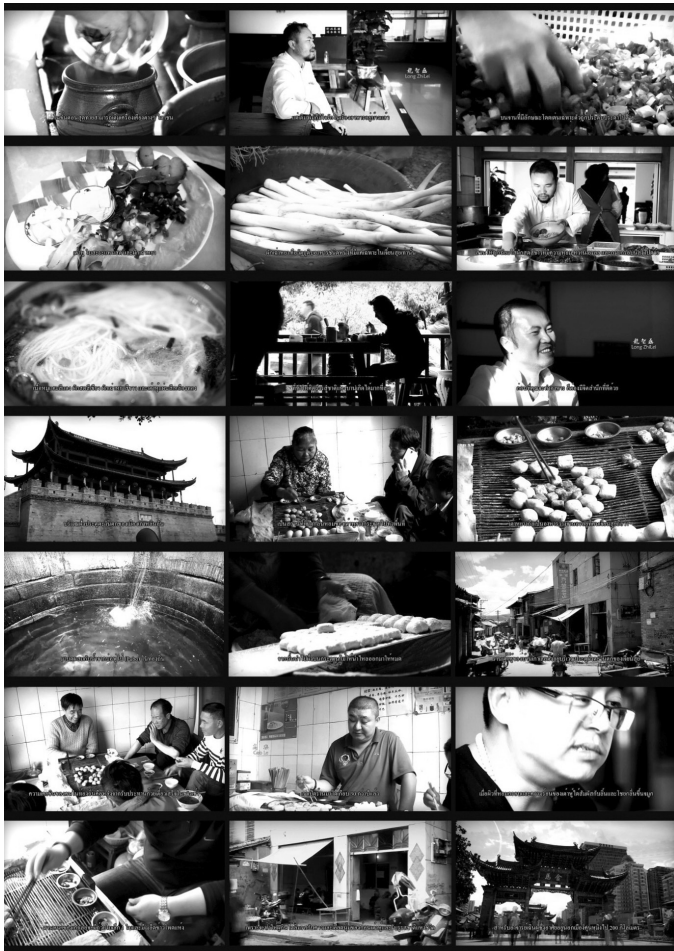
ภาพที่ 12 ผลงานสารคดีสั้นเรื่อง “รสชาติแห่งบ้านเกิด” 2