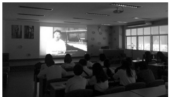
ภาพที่ 9 บรรยากาศขณะฉายสารคดี (Lin Hongjun, 2016)