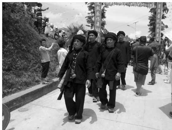
ภาพที่ 5 รูปการแต่งกายของผู้ชายเผ่าฮาหนี