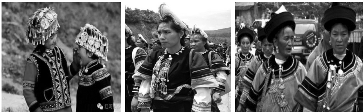
ภาพที่ 7 รูปการแต่งกายของผู้หญิงเผ่าฮาหนี