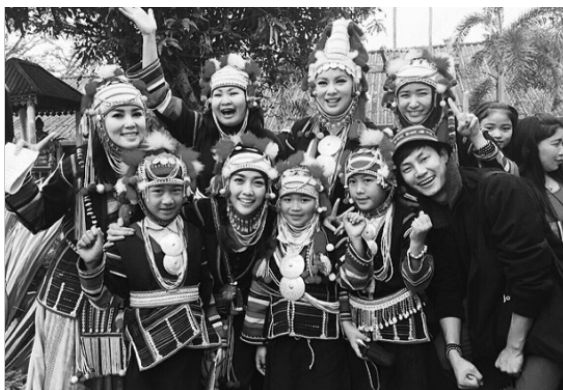
ภาพที่ 6 รูปการแต่งกายของผู้หญิงเผ่าฮาซง

การแต่งกายของผู้หญิงเผ่าฮาซงแบบ ผาหมีฮาซง ใส่กระโปรงอัดกลีบสีน้ำเงินหรือดำ เสื้อสีดำหรือน้ำเงิน คอกลมผ่าหน้า แขนยาวกั้นผ้าสีต่างๆ จากข้อมือถึงใต้รักแร้ สนับแข้งสีดำหรือน้ำเงิน ปักลายเหมือนกับลายปักเสื้อด้านหลัง บริเวณหน้าอกตกแต่งด้วยแผ่นเงินเล็กบ้างใหญ่บ้าง หมวกผ้าประดับด้วยเม็ดเงินกลมผ้าซีกรอบศีรษะ แนวหูประดับเงินเหรียญเก่า มีสายรัดคางเป็นเงิน และลูกปัดหลากสี