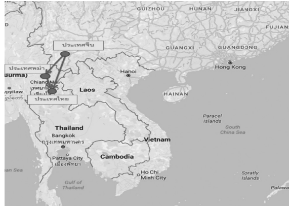
ภาพที่ 1 แผนที่อพยพที่อยู่ของชนเผ่าฮา ที่มา: ออนไลน์. (ผู้วิจัยปรับปรุงข้อมูลแผนที่)

3. กลุ่มที่สามเรียกว่า “อายอักซ่า” อพยพเข้ามาในประเทศไทย อพยพเข้ามาประมาณ 70 ปี ที่ผ่านมา อาศัยอยู่ที่อำเภอแม่สาย จังหวัดเชียงราย อีโก้กลุ่มนี้ทั้งชายและหญิงไม่ชอบแต่งชุดประจำเผ่า แต่มักใส่เสื้อผ้าเช่นเดียวกับคนไทยพื้นเมือง บางครั้งถ้าดูลักษณะต่างๆ ไปแล้วจะไม่ทราบว่าเป็นฮา