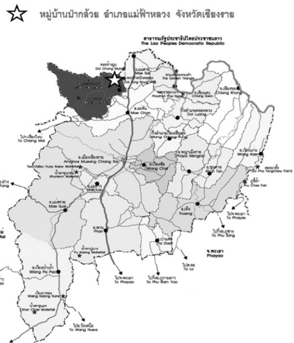
ภาพที่ 2 แผนที่ของชนเผ่าฮาในประเทศไทย ที่มา: ออนไลน์. (ผู้วิจัยปรับปรุงข้อมูลแผนที่)