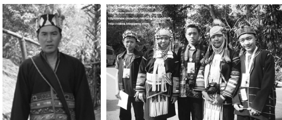
ภาพที่ 4 รูปการแต่งกายของผู้ชายเผ่าอาข่า

การแต่งกายของผู้ชายเผ่าอาข่าแบบ ผาหม้ออาข่า เสื้อผู้ชายตัวยาวกว่าอาข่ากลุ่มอื่นเย็บด้วยแถบผ้าก๊วยขาว เรียงซ้อนกัน อาจติดกระดุมหน้าหรืออ้อมไปติดกระดุมข้างซ้าย มักประดับสาบหน้าด้วยเหรียญเงิน หรือสร้อยเงินร้อยลูกกระพรวน กางเกงก็คล้ายกับกลุ่มอื่น