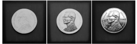
ภาพที่ 11 ผลงานจิตรกรรมชุดต่อเนื่องเทคนิคสีอะครีลิคบนผ้าใบ ขนาด 40 cm. x 40 cm.