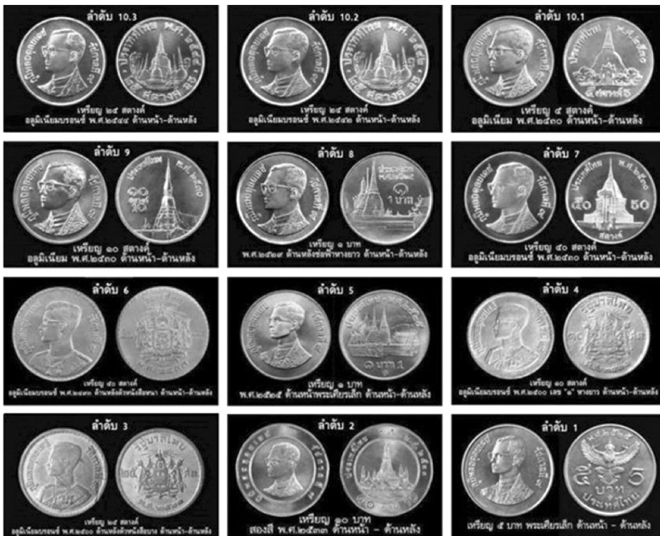
ภาพที่ 1 แสดงลำดับเหรียญกษาปณ์หมุนเวียนในรัชกาลที่ 9 ที่เป็นที่ยอมรับของนักสะสม

เหรียญกษาปณ์หมุนเวียนชุดปัจจุบันจึงมี 8 ชนิดราคา ได้แก่ เหรียญราคา 10 บาท 5 บาท 1 บาท 50 สตางค์ 25 สตางค์ 10 สตางค์ 5 สตางค์ และ 1 สตางค์ ซึ่งจัดทำได้ครบทุกชนิดราคาใน พ.ศ. 2531 ในส่วนของขนาดเหรียญได้กำหนดให้มีความแตกต่างกัน โดยมีขนาดใหญ่เล็กลดหลั่นกันตามราคาหน้าเหรียญประมาณ 2 มิลลิเมตรเพื่อความสะดวกในการใช้สอย สำหรับส่วนผสมได้ปรับเปลี่ยนให้สอดคล้องกับราคาหน้าเหรียญเพื่อลดปัญหาต้นทุนการผลิต อีกทั้งยังอิงไปตามหลักสากลในการผลิตเหรียญกษาปณ์หมุนเวียนที่กำหนดให้ใช้โลหะที่มีมูลค่าไม่เกินร้อยละ 40 ของราคาหน้าเหรียญ