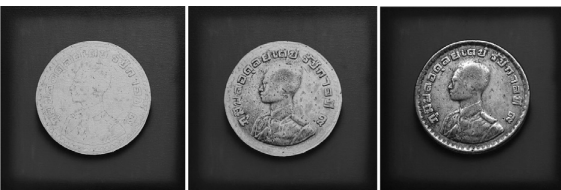
ภาพที่ 9 ผลงานจิตรกรรมชุดต่อเนื่องเทคนิคสีอะครีลิคบนผ้าใบ ขนาด 40 cm. x 40 cm.

สรุปประเด็นปัญหาในการออกแบบสร้างสรรค์ผลงาน ภาพเสมือนจริงจากเหรียญกษาปณ์ในรัชกาลที่ 9 ปี ตั้งแต่ปี พ.ศ. 2554 จนถึงปัจจุบัน ดังจะสังเกตเห็นได้จากผลงานในลำดับภาพที่ 7-11 ว่าในช่วงต้นของการออกแบบสร้างสรรค์ ผลงานนั้นมุ่งเน้นไปในเรื่องการให้ความสำคัญกับตัวภาพการให้ รายละเอียดภาพค่อนข้างน้อยและไม่ให้ความสำคัญกับเรื่องราวภาพและบรรยากาศโดยรวม อันที่จะช่วยส่งเสริมให้ผลงาน