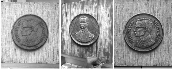
ภาพที่ 6 แสดงแผนผังของขั้นตอนการทำงาน ในช่วง Post Production