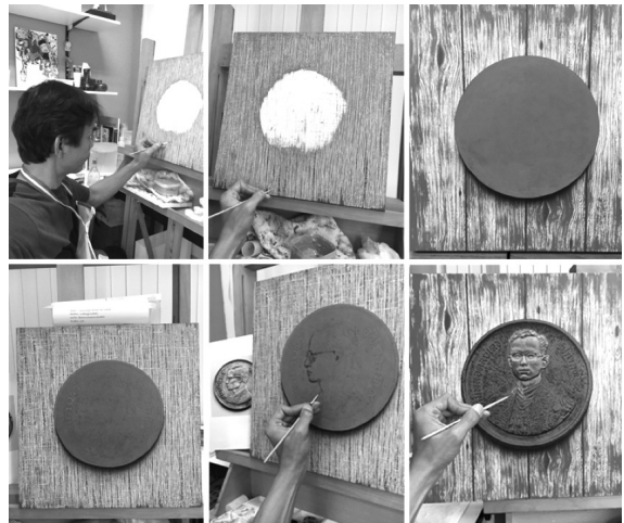
ภาพที่ 5 แสดงแผนผังของขั้นตอนการทำงานในช่วง Production

2.3 การใส่รายละเอียดความเสมือนจริงปรับเปลี่ยนแต่งแก้ไขภาพให้สวยงาม เนื่องจากการผลิตเหรียญกษาปณ์นั้น มีขั้นตอนที่ละเอียดซับซ้อนมากซึ่งอาจจะเกิดข้อผิดพลาดบางประการเกี่ยวกับรายละเอียดของชิ้นงานในการสร้างงานในขั้นตอนนี้จึงต้องมีการออกแบบให้สวยงามหรือแก้ไขภาพให้มีความสมบูรณ์มากยิ่งขึ้น