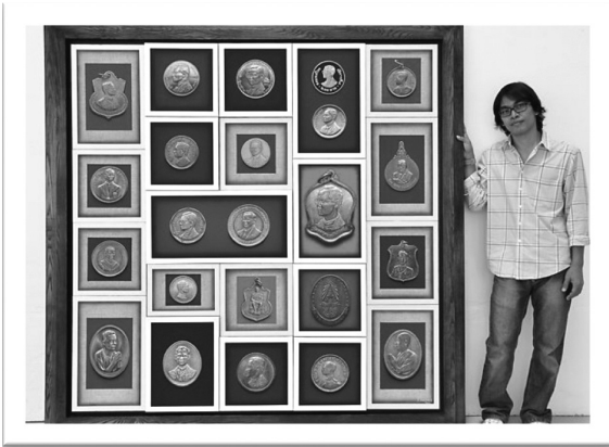
ภาพที่ 7 ผลงานจิตรกรรมรวมชุดต่อเนื่องเทคนิคสีอะครีลิคบนผ้าใบในกรอบ ขนาด 175 cm. x 175 cm.