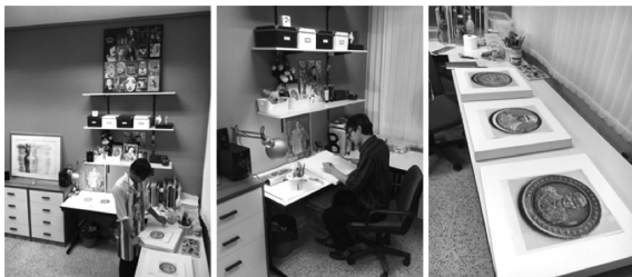
ภาพที่ 4 แสดงการวางแผนการดำเนินงานในช่วง Pre-Production

1.3 มิติภาพและภาพรวมของเหรียญกษาปณ์ต้องนำมาสร้างเป็นต้นแบบและพัฒนาไปเป็นแบบร่างได้