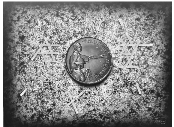
ภาพที่ 12 ผลงานจิตรกรรมชุดต่อเนื่องเทคนิคสีอะครีลิคบนผ้าใบ ขนาด 70 cm. x 70 cm.