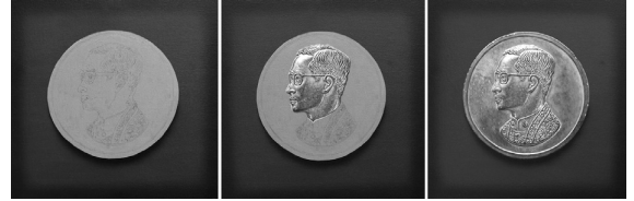
ภาพที่ 10 ผลงานจิตรกรรมชุดต่อเนื่องเทคนิคสีอะครีลิคบนผ้าใบ ขนาด 40 cm. x 40 cm.