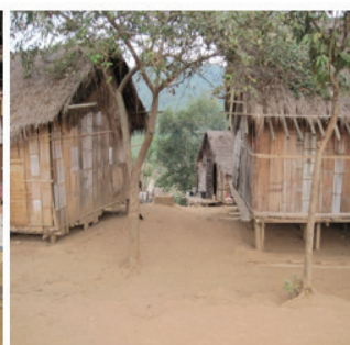
ภาพที่ 3 แสดงถึงสภาพแวดล้อมในหมู่บ้านลาหู่ที่อยู่บนที่ราบสูง ปลูกบ้านแบบดั้งเดิม