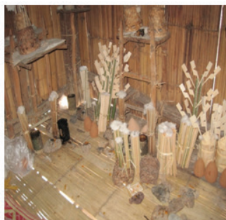
ภาพที่ 1 แสดงถึงการบูชาผีบรรพบุรุษของชาวลาหู่

อาชีพ เงินทอง หนี้สิน อาชีพหลักของชาวลาหู่ คือการทำเกษตรกรรม อาทิ ทำไร่ ทำสวน ปลูกข้าว ข้าวโพด ผลไม้ และพืชหมุนเวียนเพื่อการบริโภคในครอบครัวและเพื่อขาย นอกจากนี้ทำการเกษตรแล้ว ชาวลาหู่ยังนิยมการเลี้ยงสัตว์ควบคู่ไปด้วย เช่น หมู และไก่ ซึ่งจะมีการเลี้ยงไว้แทบทุกบ้าน เพื่อขายและใช้ในการประกอบพิธีกรรม รองลงมา คือ การไปรับจ้างในเมือง ทำก่อสร้างในช่วงที่พักจากฤดูทำไร่ ทำสวน หมู่บ้านที่อยู่พื้นที่ราบ มีชาวบ้านหลายรายที่ประกอบอาชีพค้าขาย เป็นพ่อค้าคนกลาง รับซื้อผลิตผลทางการเกษตรจากภายในหมู่บ้านต่างๆ แล้วนำไปขายต่อให้กับพ่อค้าในเมือง โรงงาน และโรงสี รายได้ส่วนใหญ่มาจากการขายข้าว ข้าวโพด ซึ่งส่วนใหญ่จะมีพ่อค้าคนกลางมารับซื้อ ทำให้ขายได้ราคาไม่ดีเท่าที่ควร ส่วนในหมู่บ้านบนภูเขาฐานะจะไม่ค่อยดีนัก เกือบทุกบ้านจะมีหนี้สินในการกู้ยืมเพื่อนำมาลงทุนซื้อปุ๋ย ยาฆ่าแมลง และเมล็ดพันธุ์ รวมถึงภาระค่าใช้จ่ายในการเช่าที่ดินทำกิน นอกจากนี้ที่ดินส่วนใหญ่ถูกนายทุนเข้ามาซื้อ จำนวนมาก จึงทำให้หลายครอบครัวต้องไปรับจ้างทำงานในไร่ รับจ้างเก็บชา รับจ้างทำสวนส้ม เป็นต้น